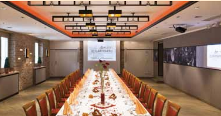
Der neue Kolbersaal - für Feste, Tagungen und Aufführungen

Sie suchen den passenden Rahmen für Ihre Feier oder eine Tagung? Der Kolberbräu bietet mehrere Räumlichkeiten für bis zu 120 Personen. Prunkstück ist unser Kolbersaal . Die Ausstattung mit innovativer Beleuchtung und moderner Medientechnik ermöglicht den passenden Rahmen für nahezu jede Veranstaltung. Der zugehörige Vorraum ist ideal für einen Sektempfang oder für das Buffet. Kulinarisch verwöhnen wir Sie ganz nach Wunsch: mit bayerischen Schmankerln oder festlich auf höchstem geschmacklichen Niveau.