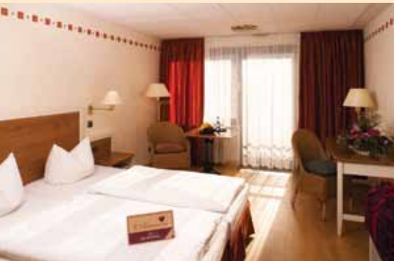
Komfort Zimmer im Neubau

Exquisit-Zimmer: Unsere Exquisit-Zimmer beeindrucken nicht nur mit ihrem einmaligen Blick auf die Tölzer Marktstraße – auch die historische Einrichtung ist einzigartig. Sie wohnen in diesen Zimmern großzügig auf 25 – 35 qm.