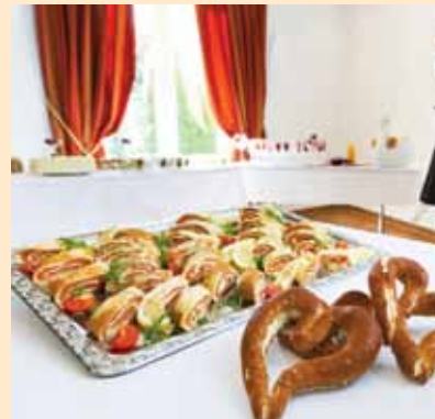
Buffet im Vorraum