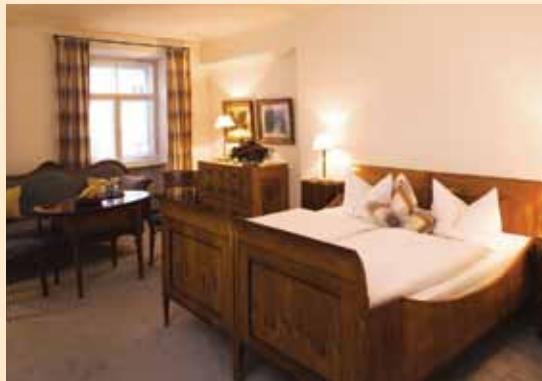
Exquisit Zimmer im Stammhaus